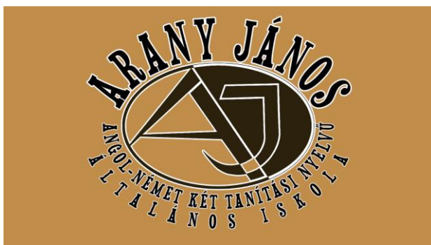
Arany János 1817 – 1882